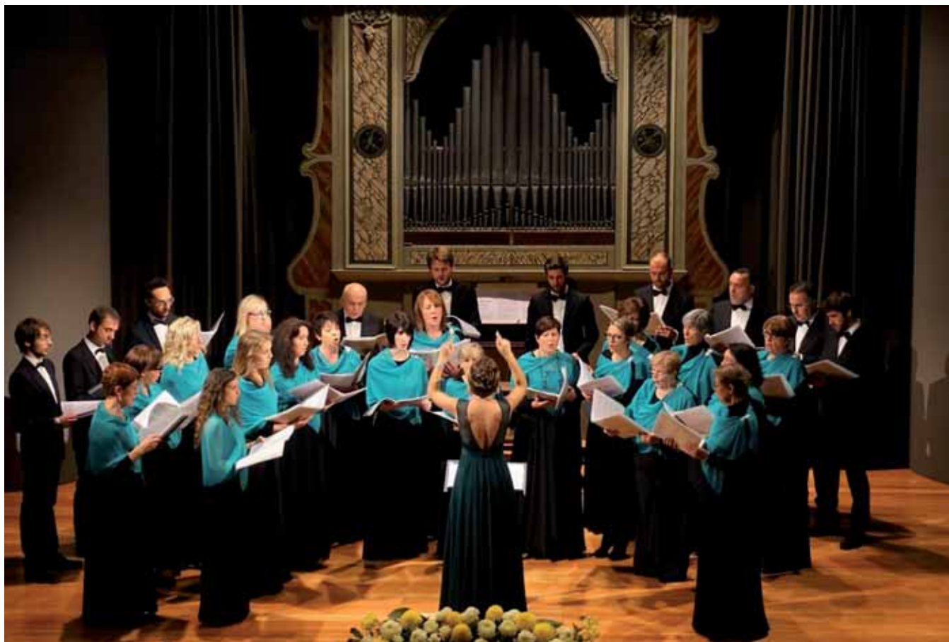
L'Accademia musicale Tetracordo